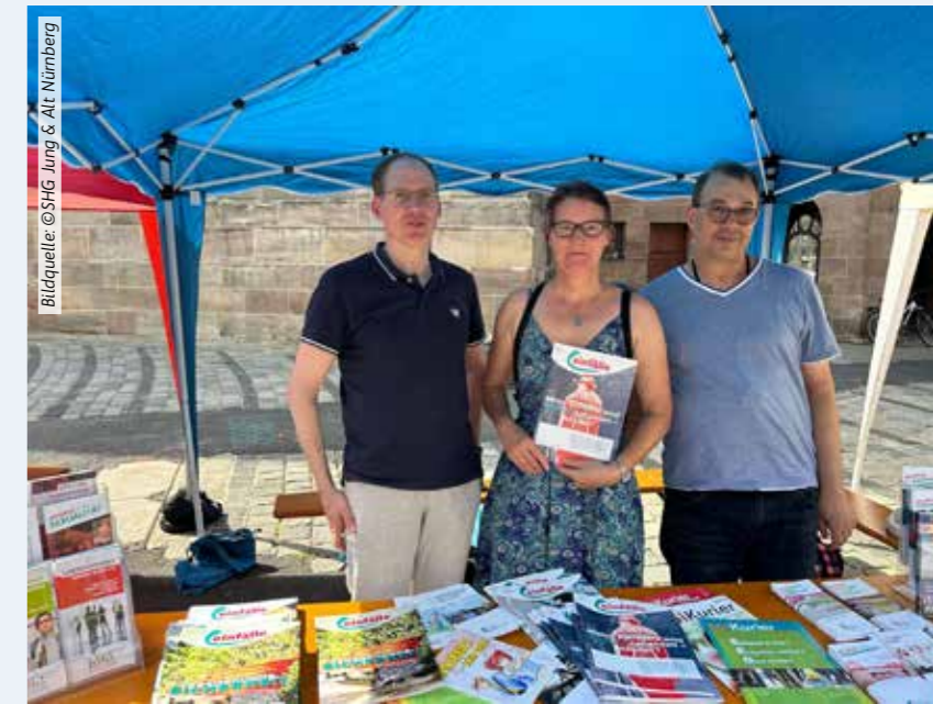
Das Team der SHG Jung & Alt Nürnberg und der SHG Erlangen